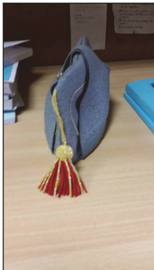
Ilustración 1. Buque de la Academia.

Para finalizar diré un famoso dicho de otra Brigada, Brigada Guzmán el Bueno, con sede en Cerro Muriano (Córdoba): "Sed fuertes en la Guerra", una frase que me animó a continuar con todo lo que me propongo.