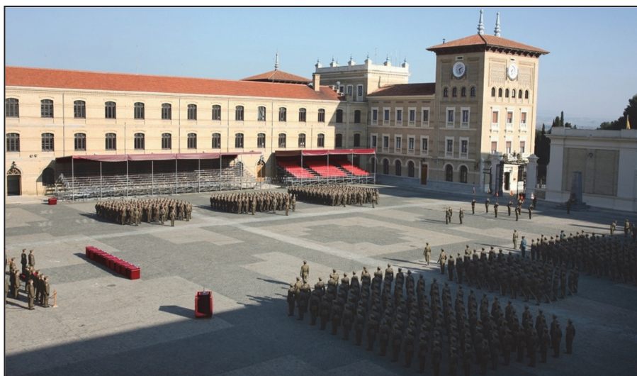
Ilustración 3. Plaza de Armas.