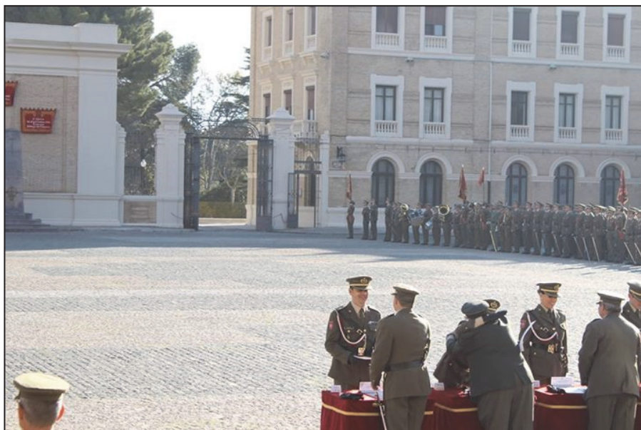
Ilustración 2. Entrega de despacho de Alférez por mi padre.