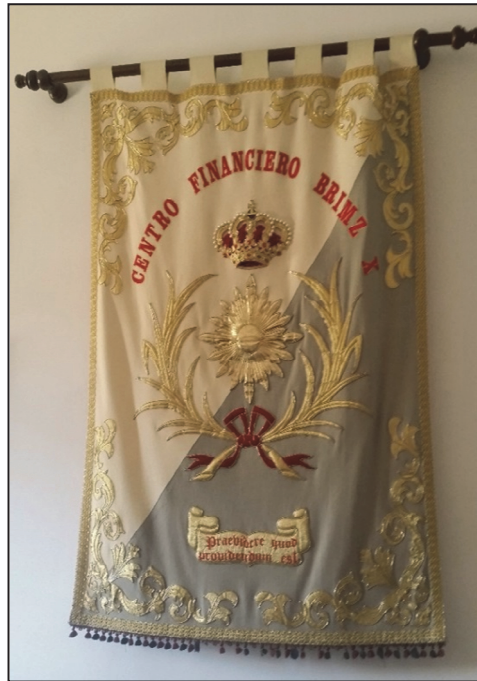
Ilustración 4. Emblema del Cuerpo de Intendencia.