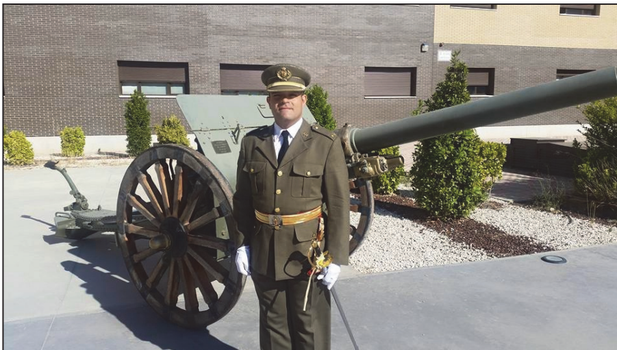
Ilustración 5. Entrega de despachos de Teniente.