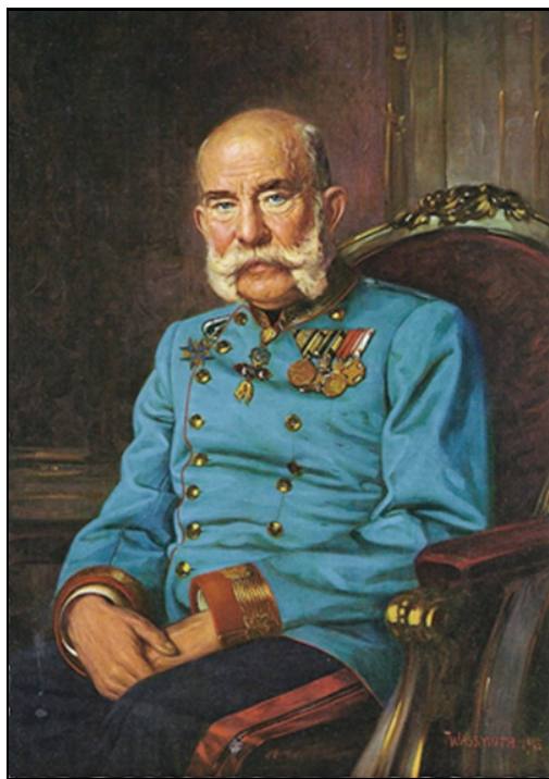
El emperador un año antes de su muerte. Cuadro de Heinrich Lorenz Wassmuth.

desde el comienzo exceptuando una pequeña mejora en 1915. A la práctica destrucción del ejército regular en el primer año de guerra y la necesidad de acudir a la movilización de reservistas y al reclutamiento civil, se unió la cada vez más subordinación al mando alemán por parte de Austria. Lo que se esperaba que fuese una guerra corta entre dos estados (Serbia y Austria) se convirtió en un conflicto prolongado a escala mundial en el que lucharon más de 60 millones de personas.