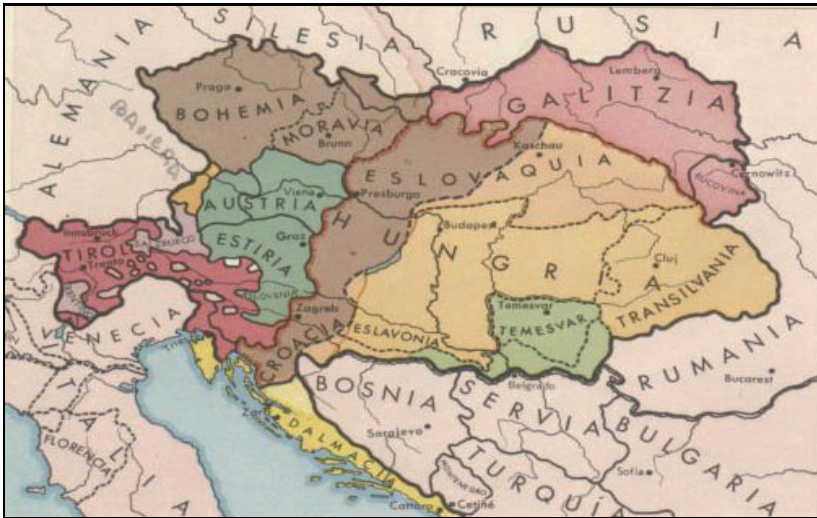
Mapa de Austria-Hungría en 1867.

Este acuerdo otorgaba la misma autonomía al Imperio Austriaco y al Reino Húngaro. Ambas entidades territoriales quedaban regidas por constituciones distintas, si bien poseían ciertas instituciones comunes. Así, los ministerios de Defensa, Finanzas y Asuntos Exteriores fueron los mismos para los dos Estados. El emperador mantenía grandes poderes ejecutivos y, junto a los ministros comunes y a los primeros ministros de Austria y Hungría formaba el Consejo de la Corona. Por medio del Ausgleich el absolutista imperio de los Habsburgo se transformó en un Estado constitucionalista.